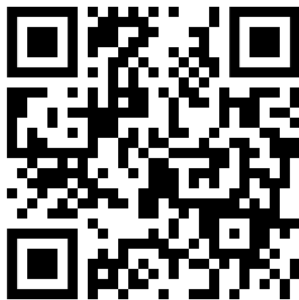
QR Code ลงทะเบียนอำเภอ